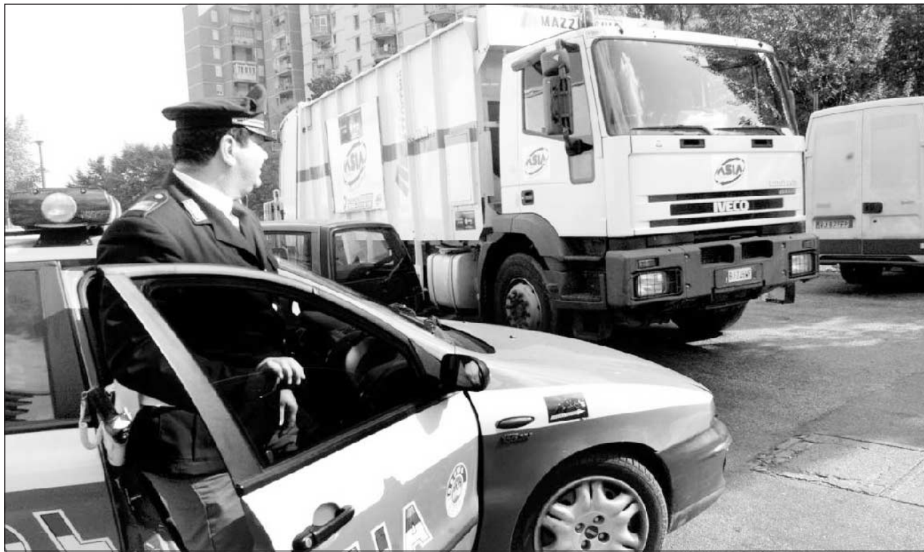
Scampia, la polizia scorta i camion dopo la denuncia degli operai Asia