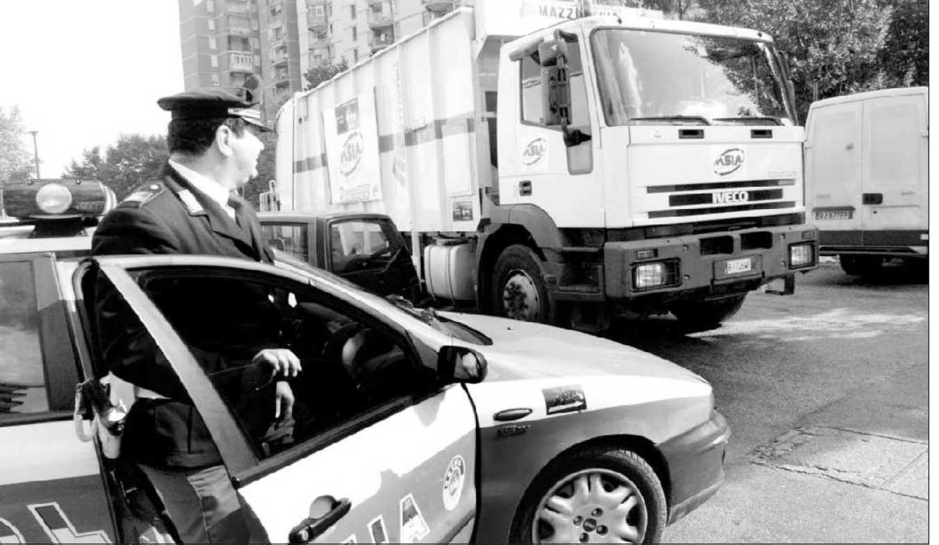
Scampia, la polizia scorta i camion dopo la denuncia degli operai Asia

Nel mirino anche il commissariato per l'emergenza discariche