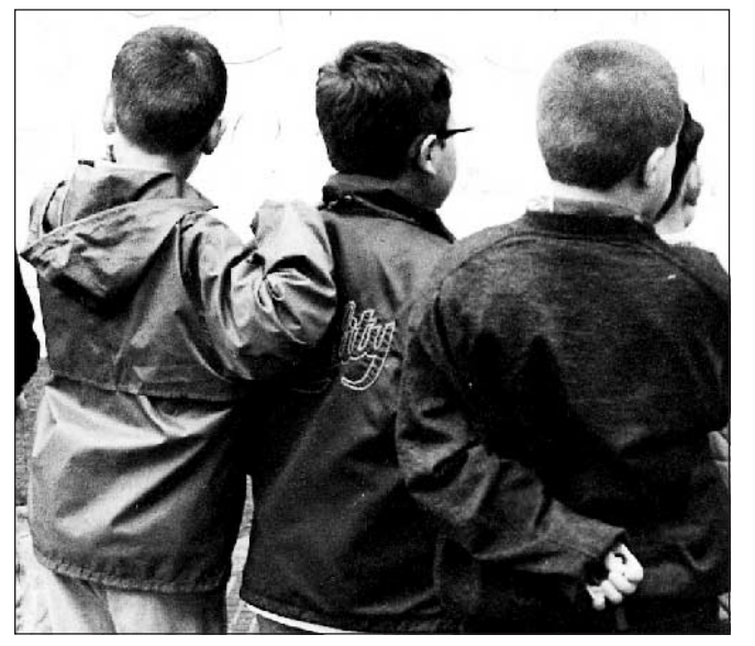
via Tevere con tre coetanei è stato aggredito da quattro ragazzi sui 12-13 anni che, con la sola violenza delle minacce verbali, gli hanno rapinato denaro (33 euro) e telefonino. I.r.u.

in scooter. Mentre i giovanissimi si riunivano nel cortile della chiesa del complesso di Trinità delle Monache (nella foto) per giocare a pallone, fino ad agosto: quando ci si accorse che avevano disegnato i confini di un campo di calcio con pittura bianca e blu, e il sagrato fu chiuso col filo spinato per impedire loro l'accesso, affinché non finissero di rovinare il monumento abbandonato. Quel che è fuor di dubbio, è che s'abbassa sempre più l'età di aggressori e vittime. L'altro ieri a Fuorigrotta uno studente di 13 anni che alle 17.30 stava camminando in