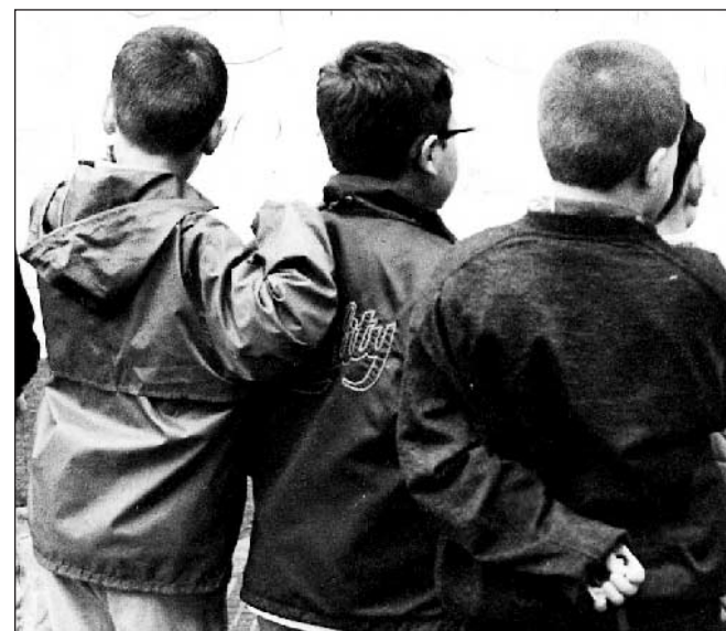
via Tevere con tre coetanei è stato aggredito da quattro ragazzi sui 12-13 anni che, con la sola violenza delle minacce verbali, gli hanno rapinato denaro (33 euro) e telefonino. I.r.u.

Quel che è fuor di dubbio, è che s'abbassa sempre più l'età di aggressori e vittime. L'altro ieri a Fuorigrotta uno studente di 13 anni che alle 17.30 stava camminando in